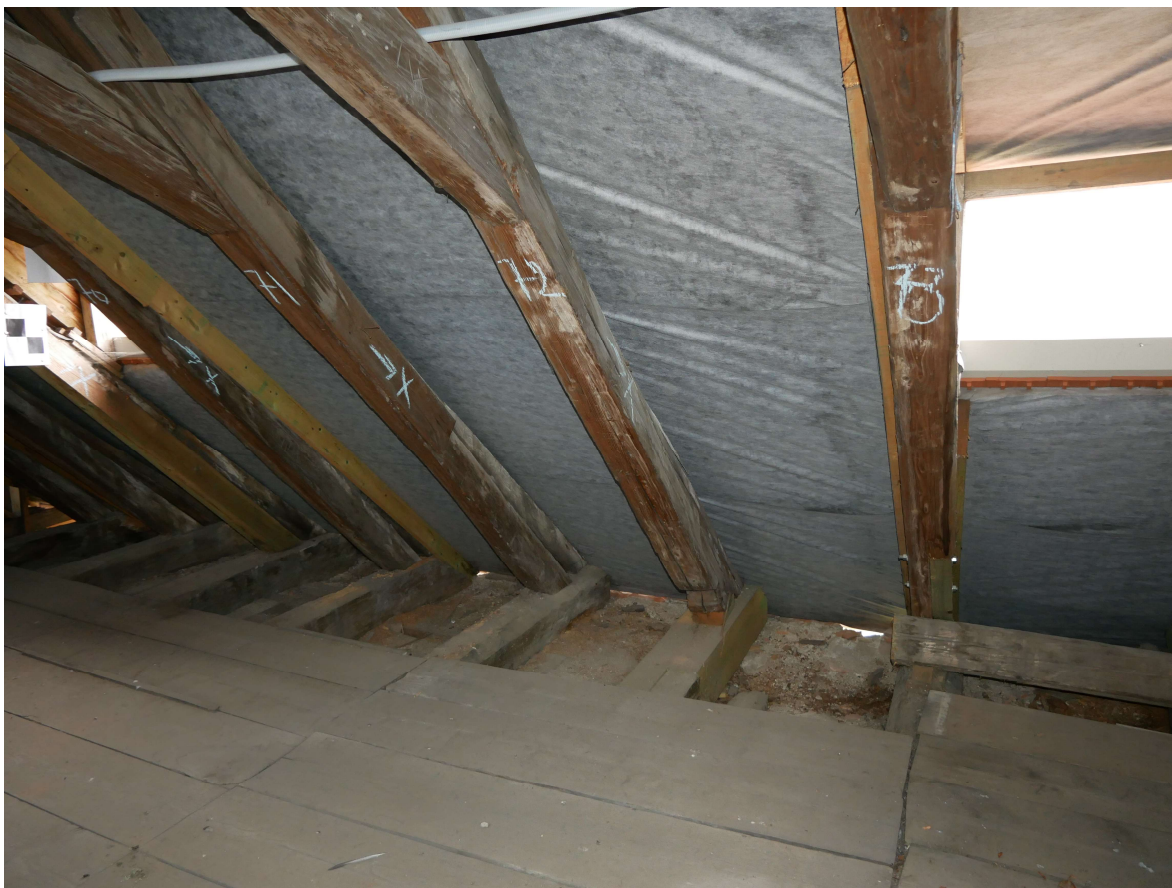
324 – severní strana krovu, pomocné příložky krokví