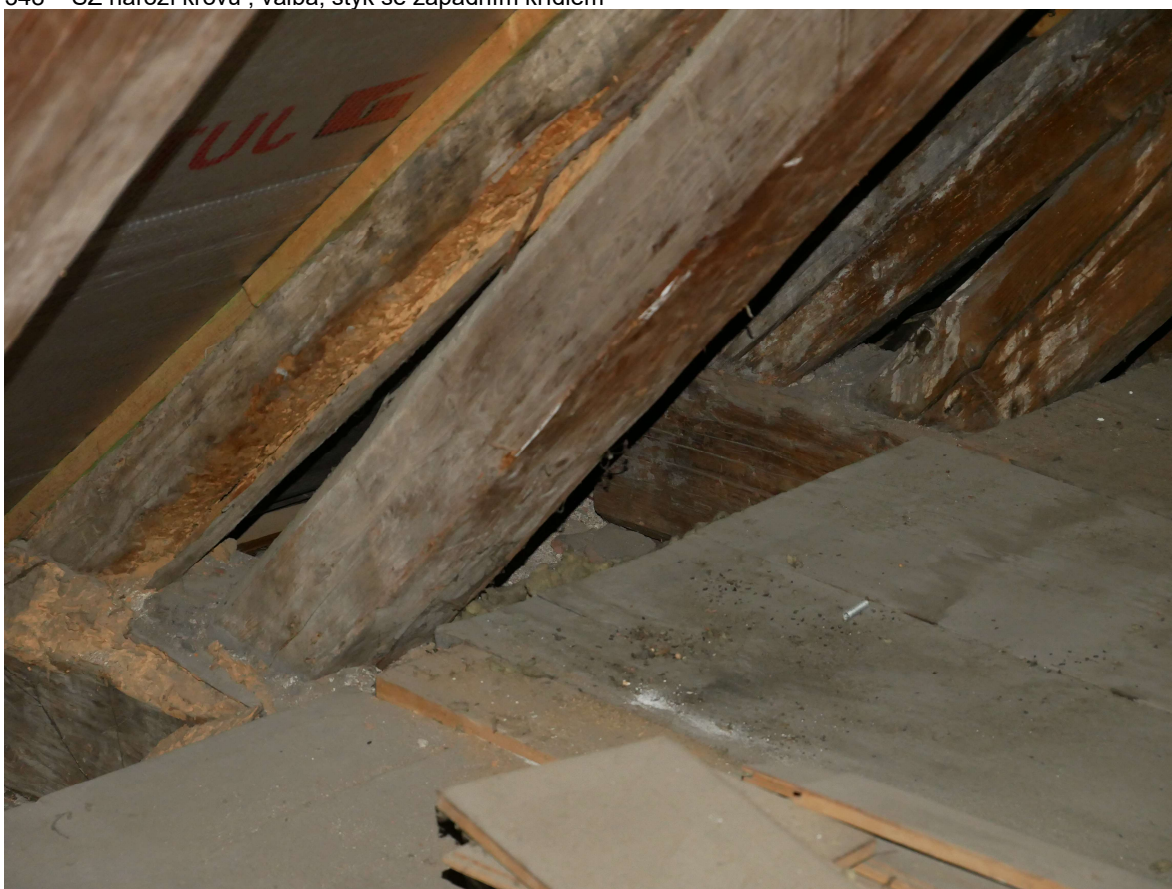
349 – valba krovu, destrukce kráčet, krokví a námětků