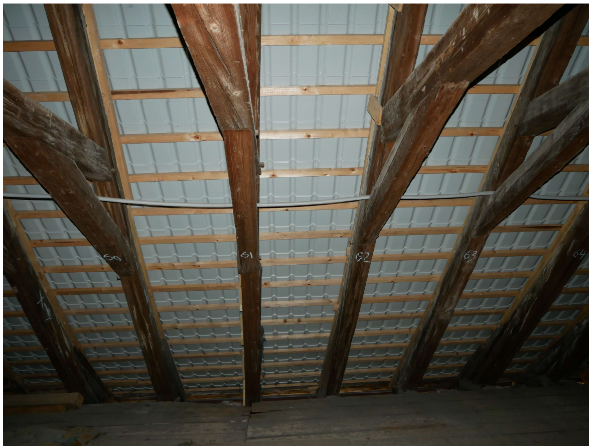
330 – severní strana krovu, rozsáhlé příložkování krokví, vazby se kácí k východu až o 0,5 m ve vrcholu