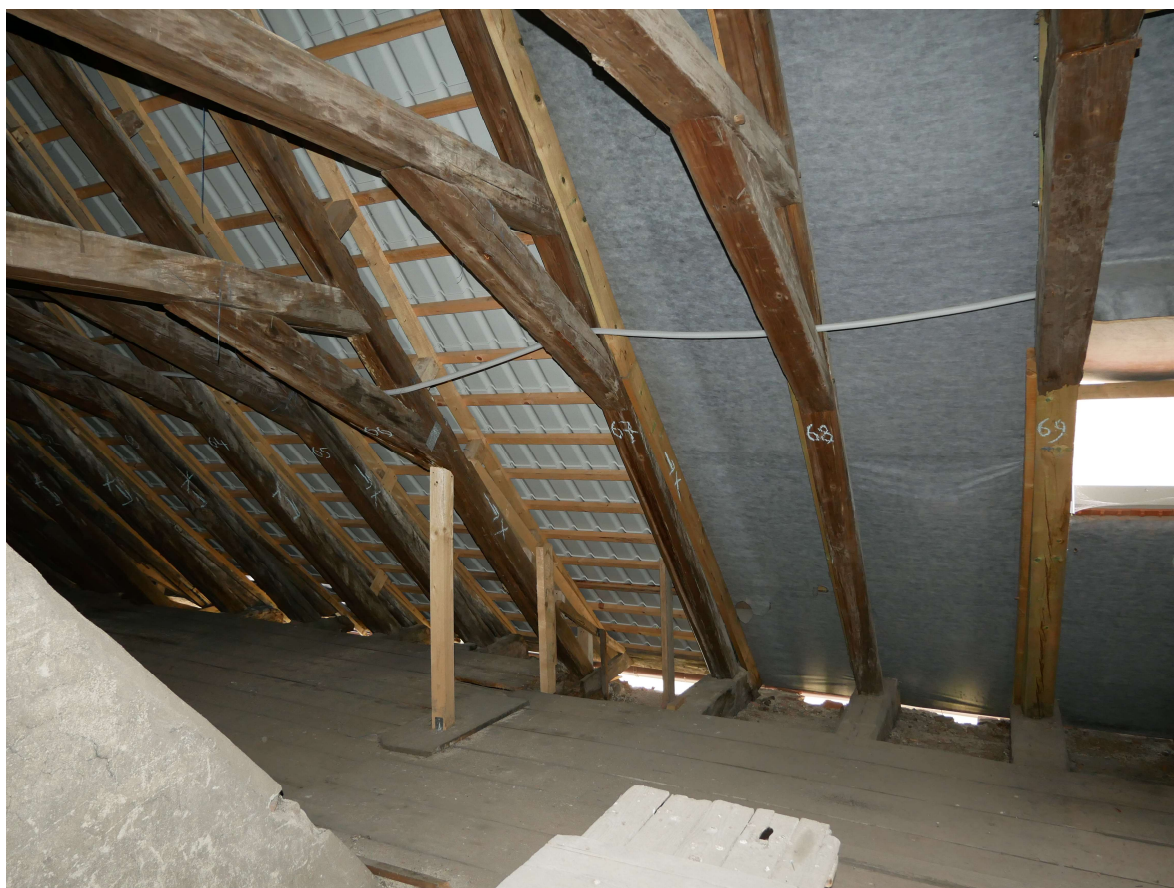
322 – severní strana krovu u třetího komínu