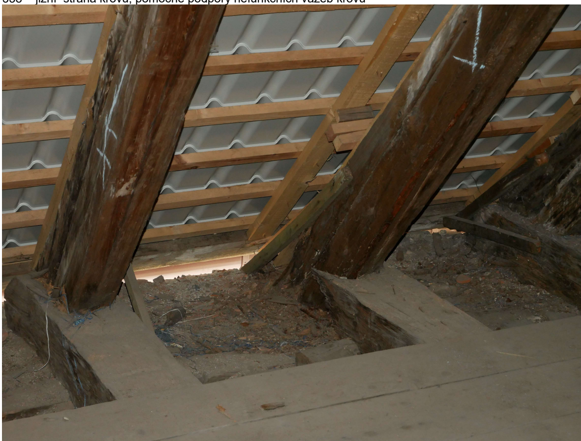
339 – jižní strana krovu, detail poškození vazných trámů, pozednice, krokvi i námětků