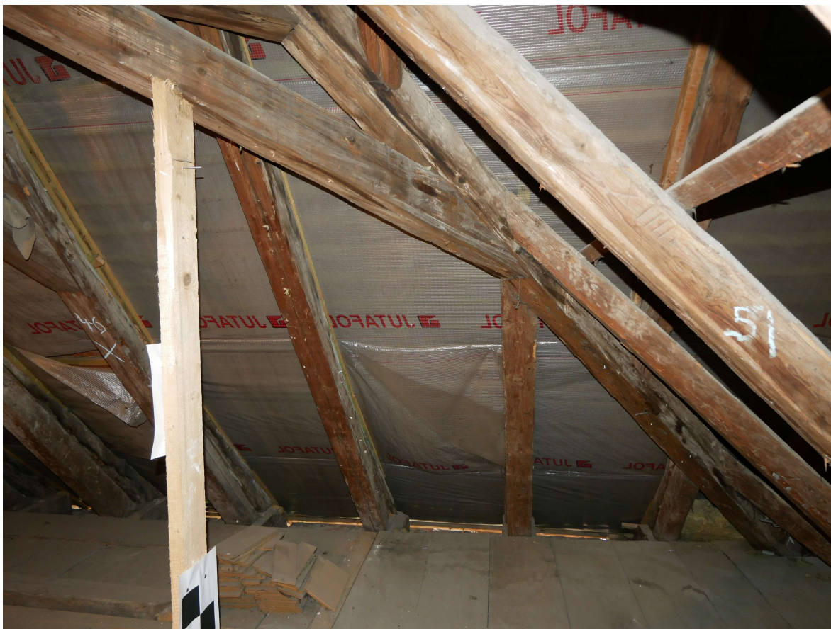
348 – SZ nároží krovu , valba, styk se západním křídlem