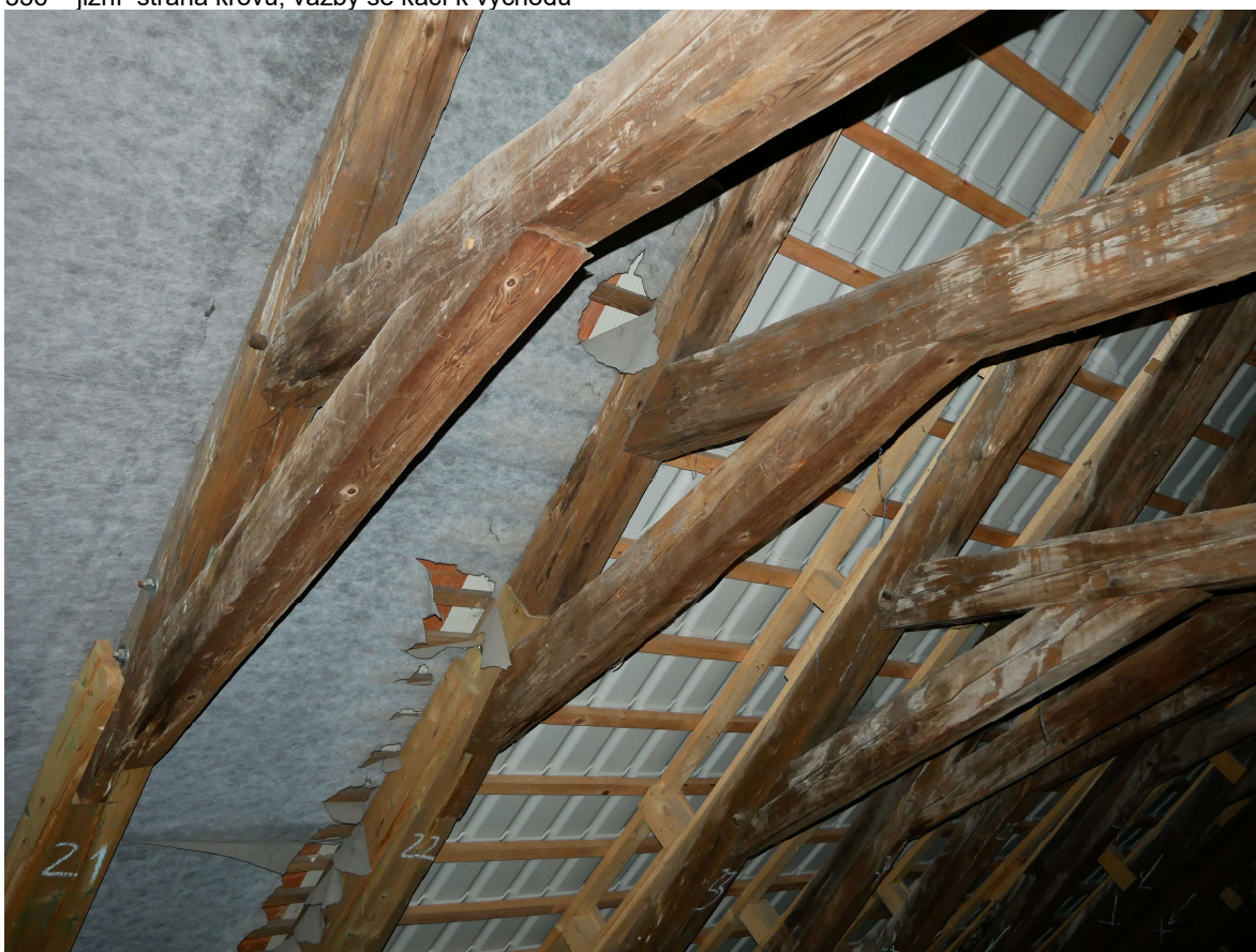
337 – jižní strana krovu, krokve pokleslé, prohnuté, vyrovnávané pomocnou kčí z prken