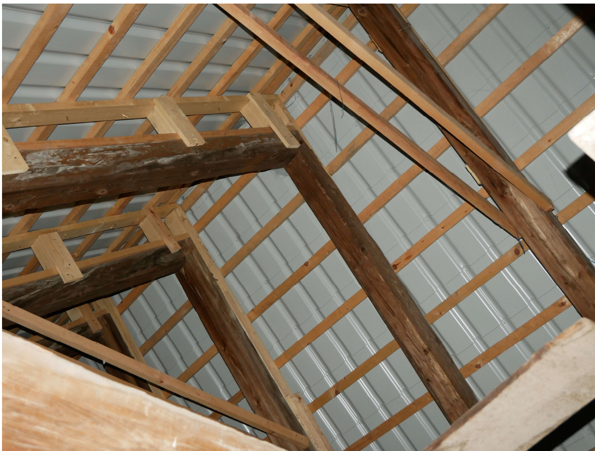
334 – vrchol krovu s plechovou krytinou, pomocné kleštiny, pomocné vyrovnávací kce z prken na horním líci krokvi