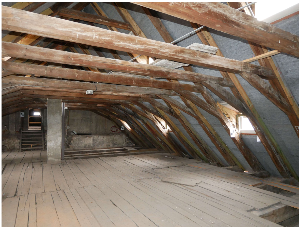
318 – jihovýchodní roh krovupomocná nepůvodní kleština, příložky krokví