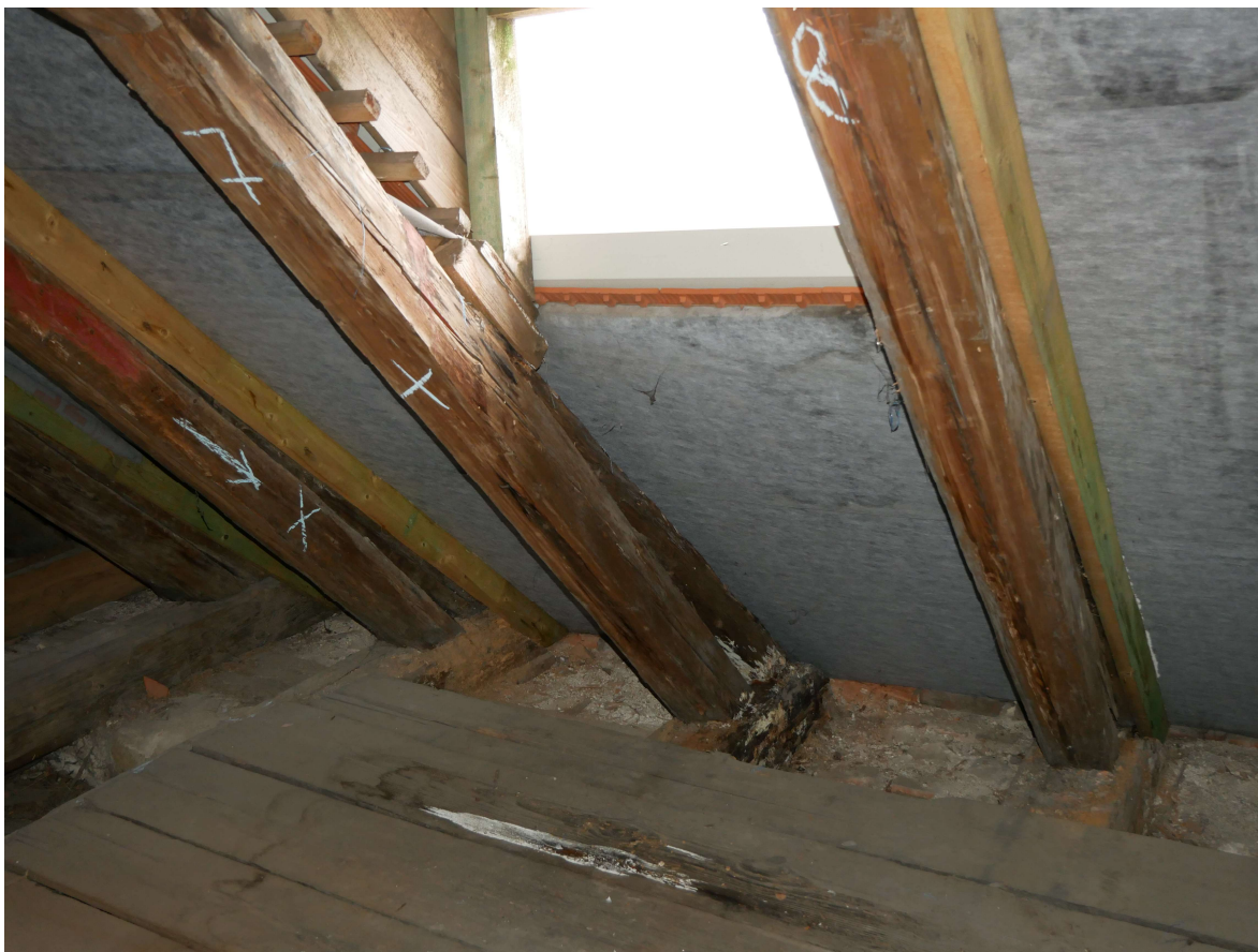
310 – detail poškození styků krokví s vaznými trámy, na podlaže stopy zatékání vikýřem