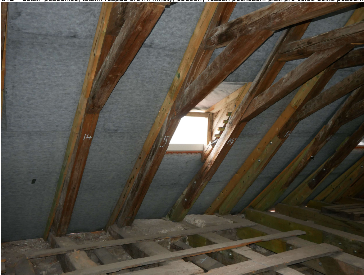
313 – jižní strana krovu na úrovni 2. komínu od východu