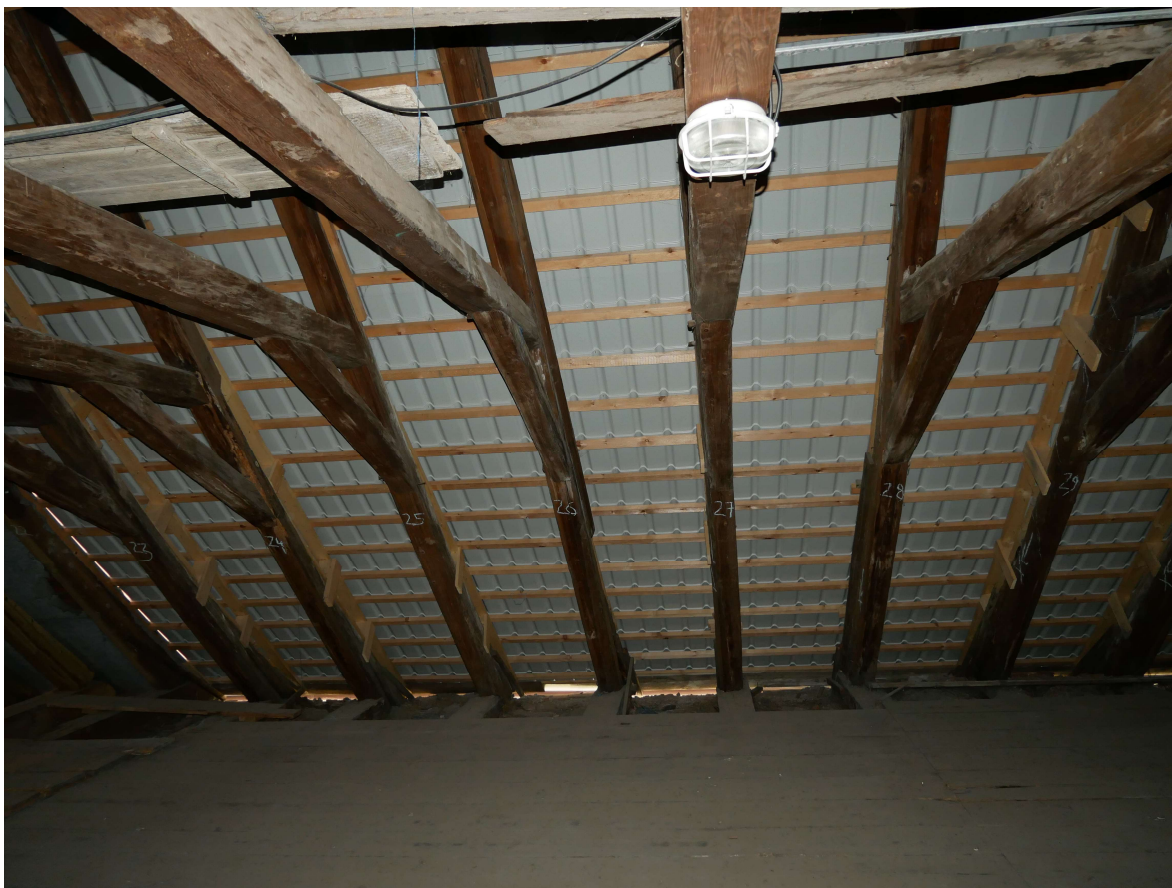
336 – jižní strana krovu, vazby se kácí k východu