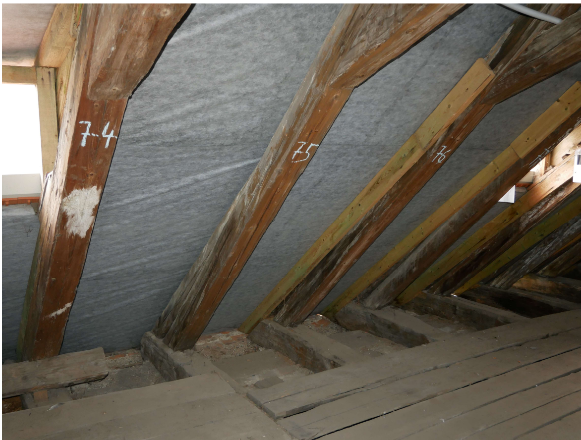
316 – severní strana krovu, pomocné příložky krokví