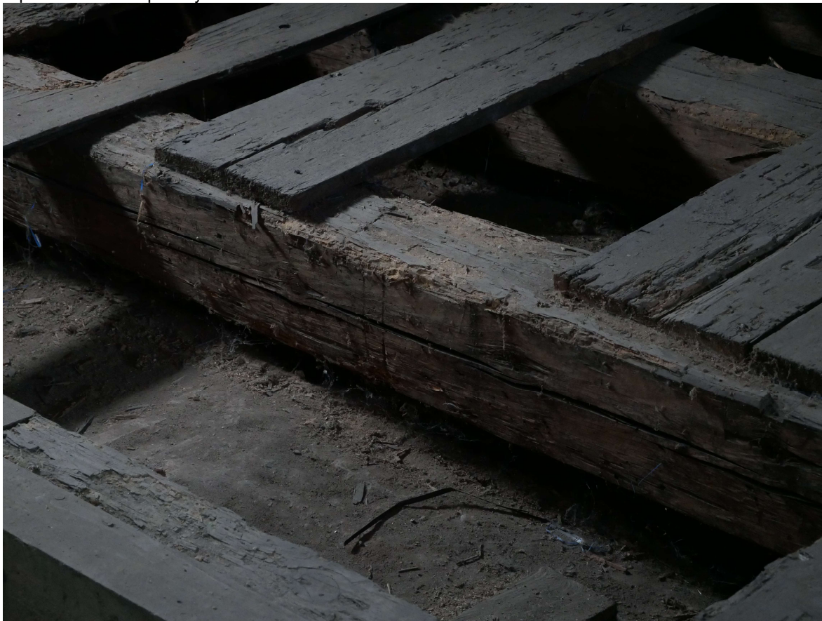
329 – detail poškození vazných trámů a podlah