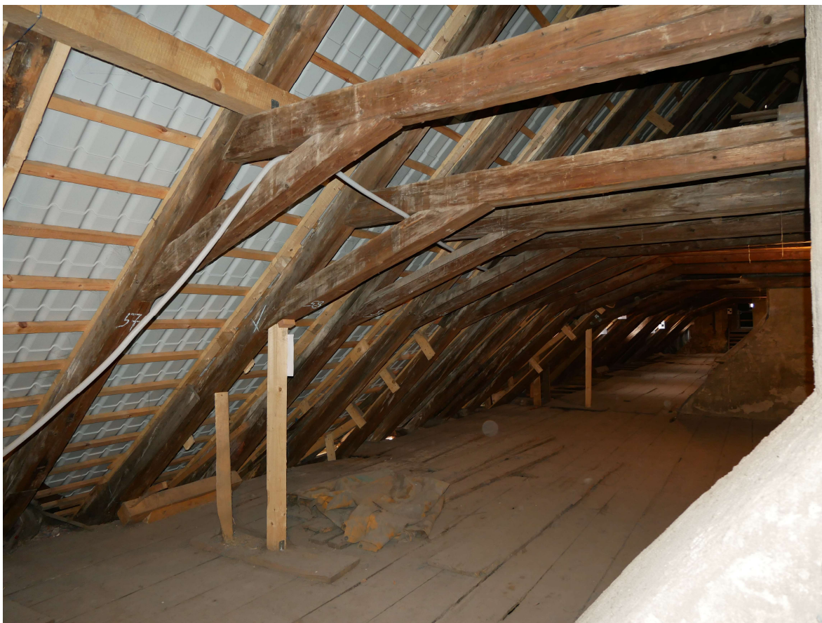
340 – severní strana krovu, provizorní podpory nefunkčních vazeb krovu