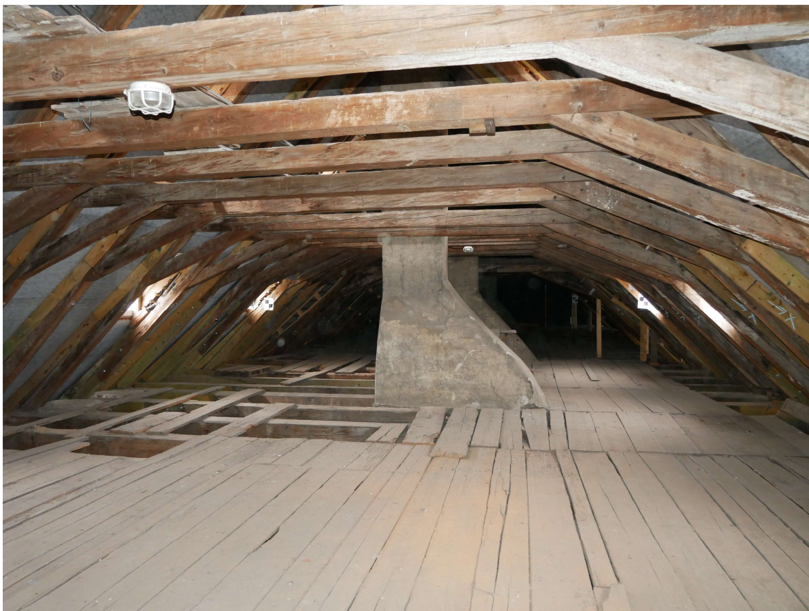
308 – pohled krovem k západu, dobře vidět je neobvykle velký volný rozpon bezvaznicového krovu, ten je kvůli tomu bohužel staticky poněkud poddimenzovaný