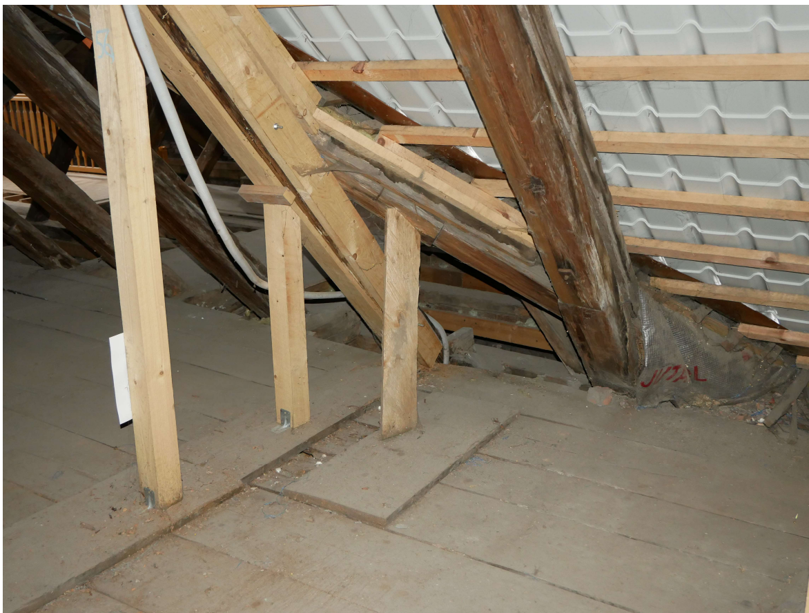
332 – detail provizorní pomocné konstrukce pod nárožní krokví