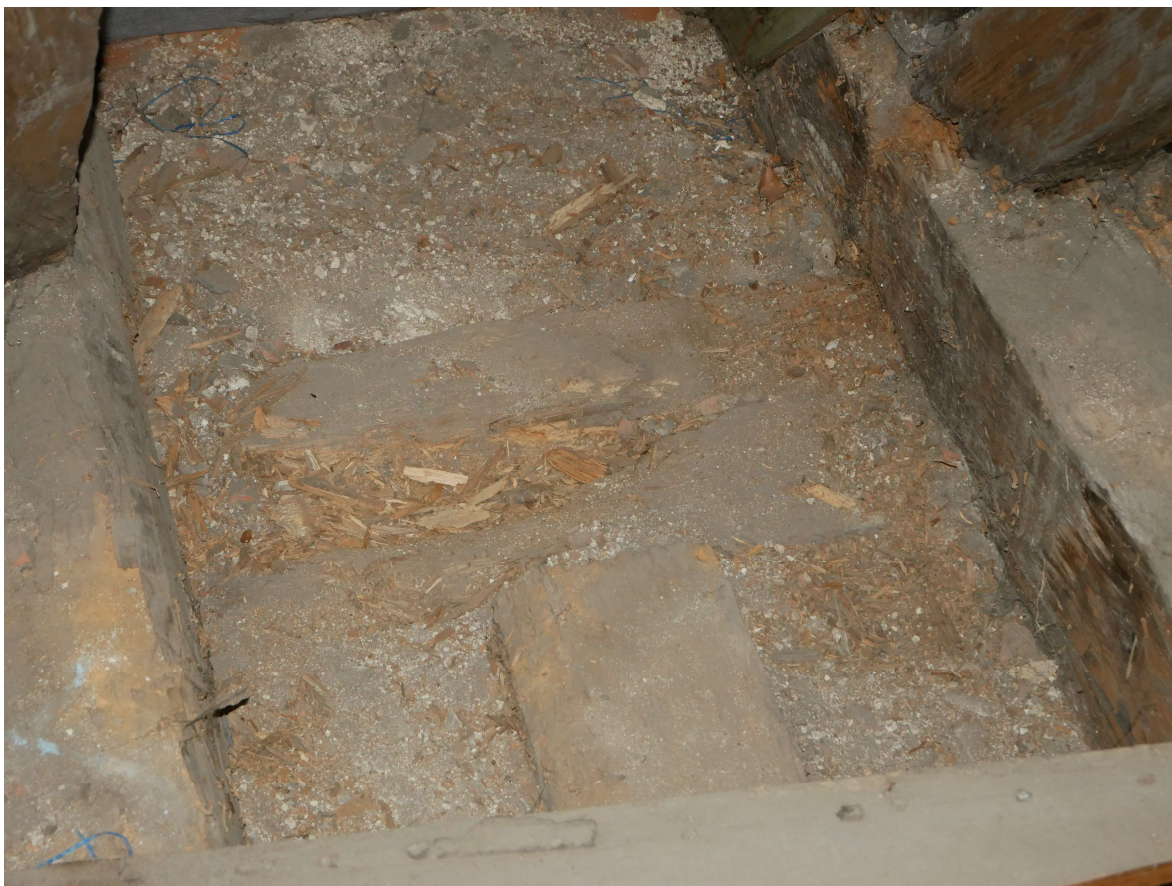
312 – detail pozednice, totální rozpad dřevní hmoty, obdobný rozsah poškození platí pro celou délku pozednice