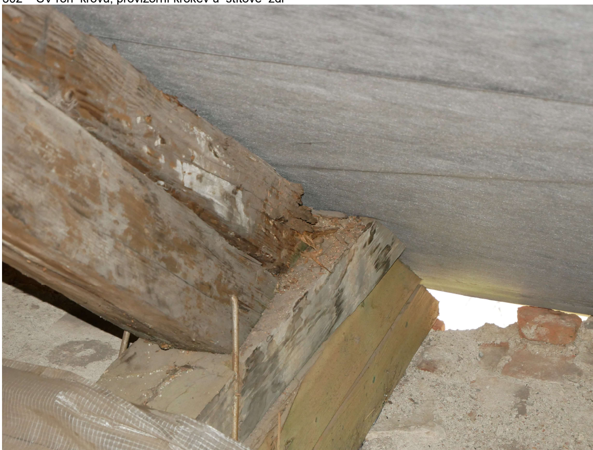
303 – krov jižního křídla, detail poškození styku krokve a námětku s vazným trámem