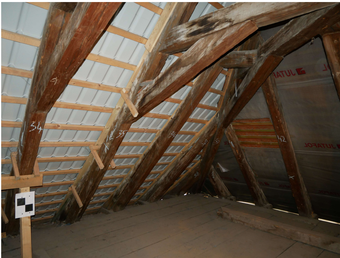
346 – JZ nároží krovu, valba