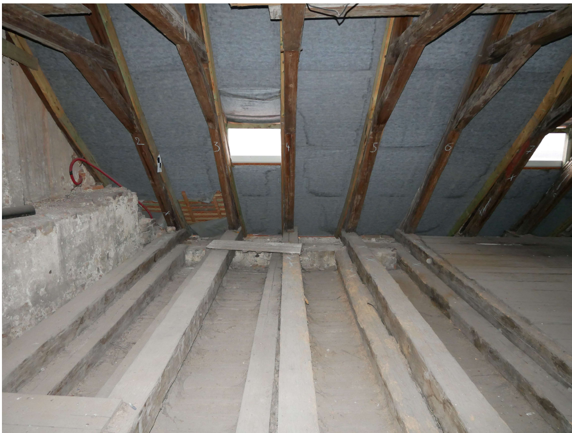
304 – JV roh krovu