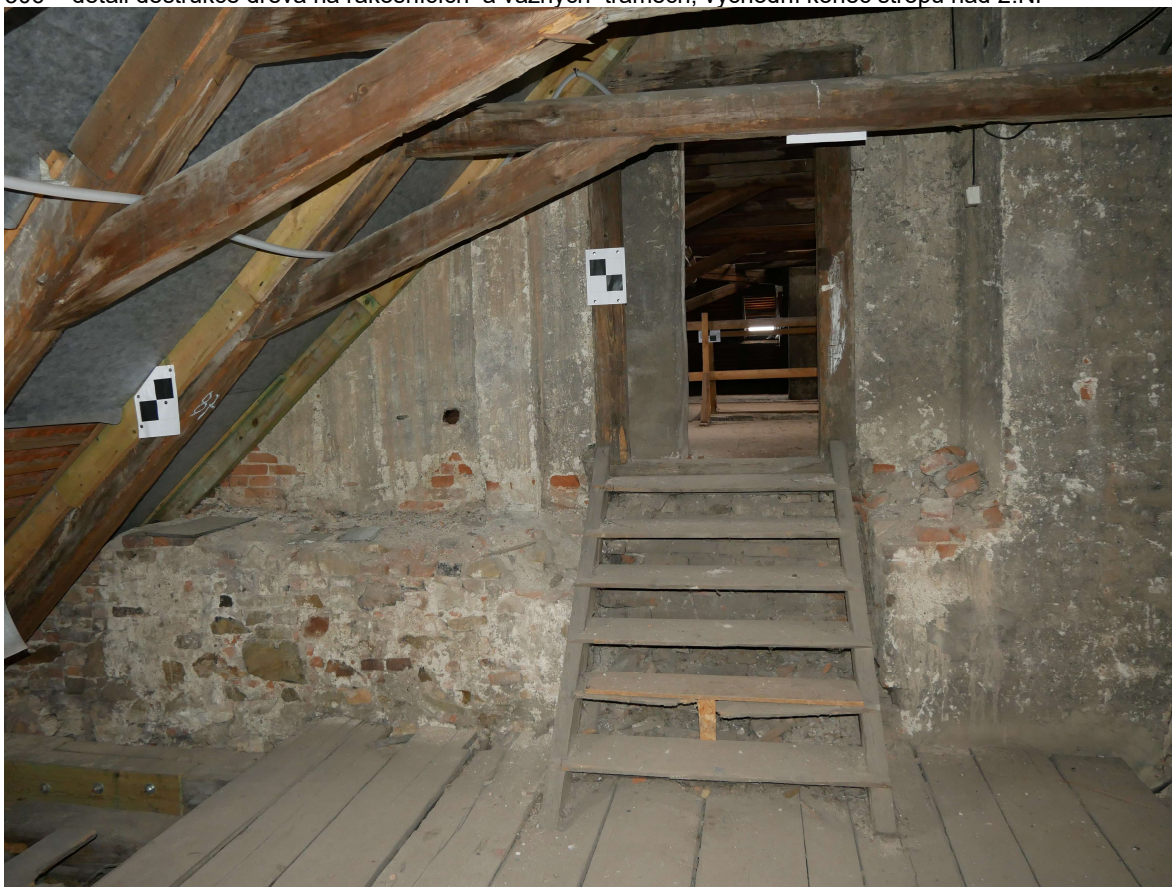
307 – vyrovnávací schůdky do krovu nad průjezdem do dvora zámku