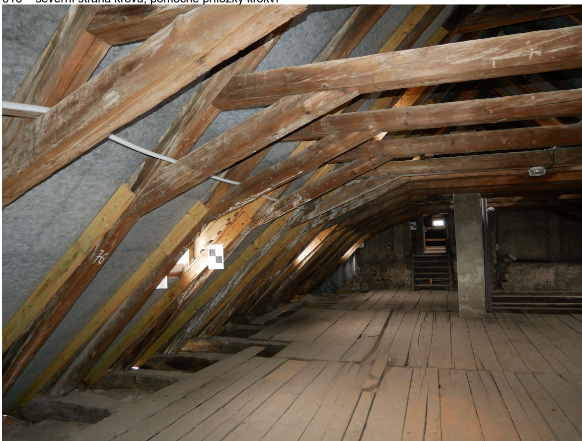
317 – severní strana krovu, průhled k východu