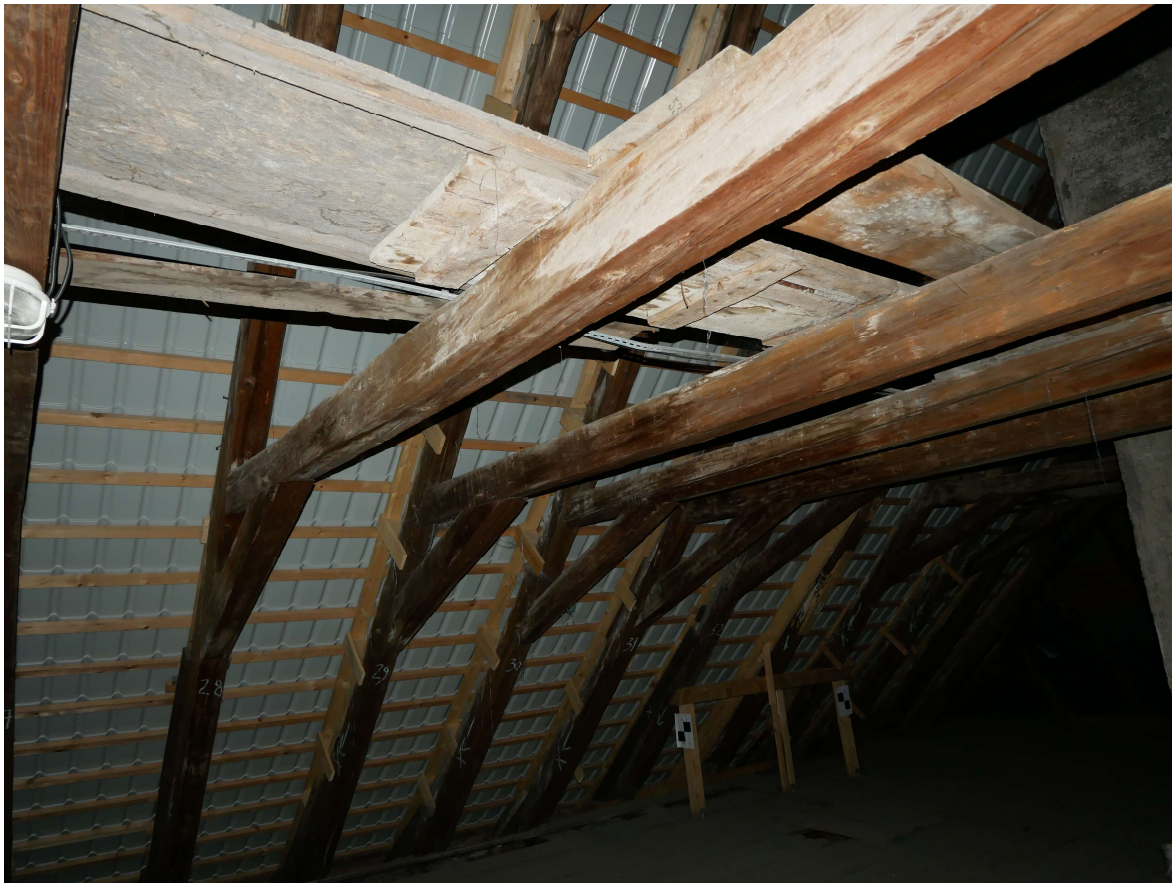
335 – jižní strana krovu na úrovni 4. komínu