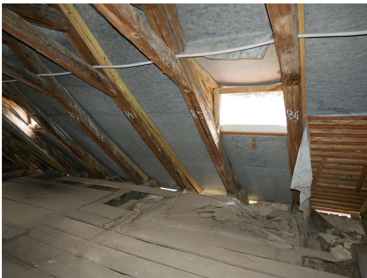
301 – jižní křídlo, SV roh krovu, nevhodný vikýř s malým sklonem pultové střechy