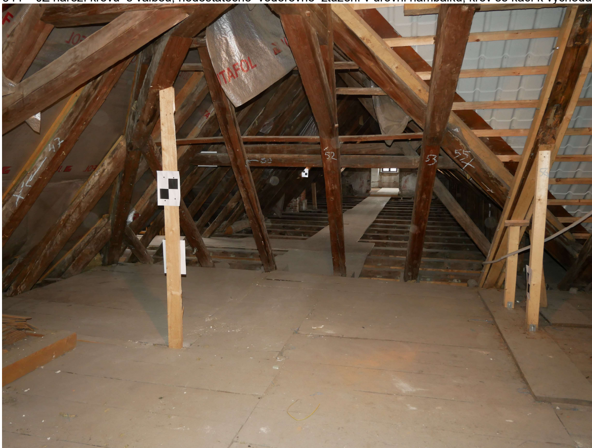
345 – průhled do krovu nad západním křídlem, vpravo provizorně zabezpečené úžlabí krovu