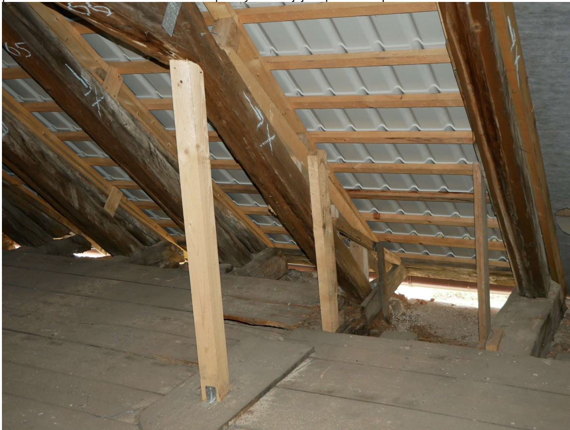
321 – destrukce vazného trámu, krokve a námětku, provizorní zesílení a podepření konstrukce