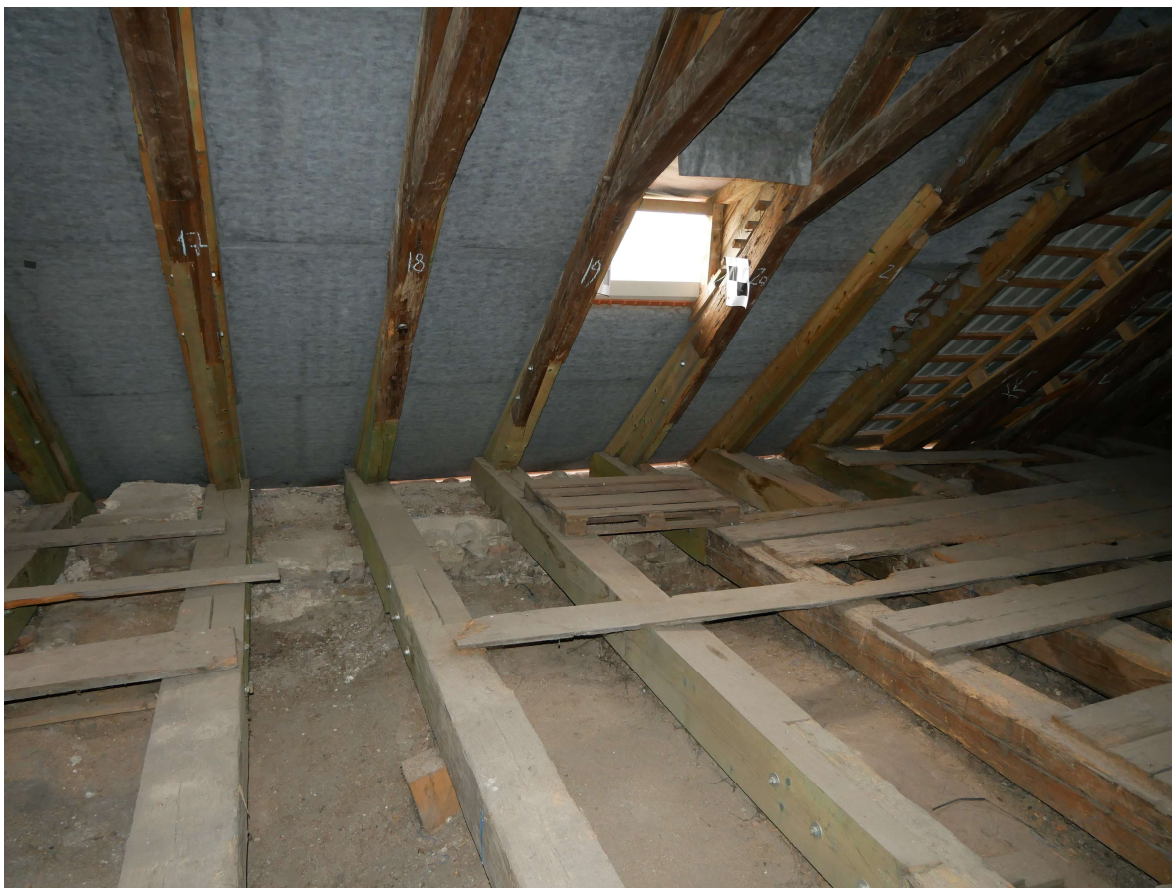
328 – jižní strana krovu, vazné trámy nad renesanční klenbou jsou o klenbu podepřené ! Nutno odstranit ! V pozadí rozsáhlé protězy krokvi