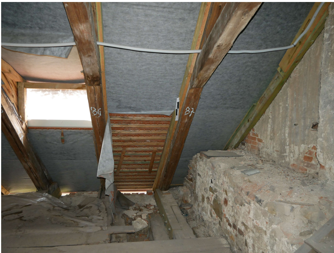
302 – SV roh krovu, provizorní krokev u štítové zdi