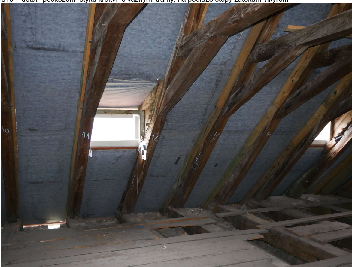
311 - jižní strana krovu, pomocné příložky na krokvích pro rektifikaci roviny střešní krytiny