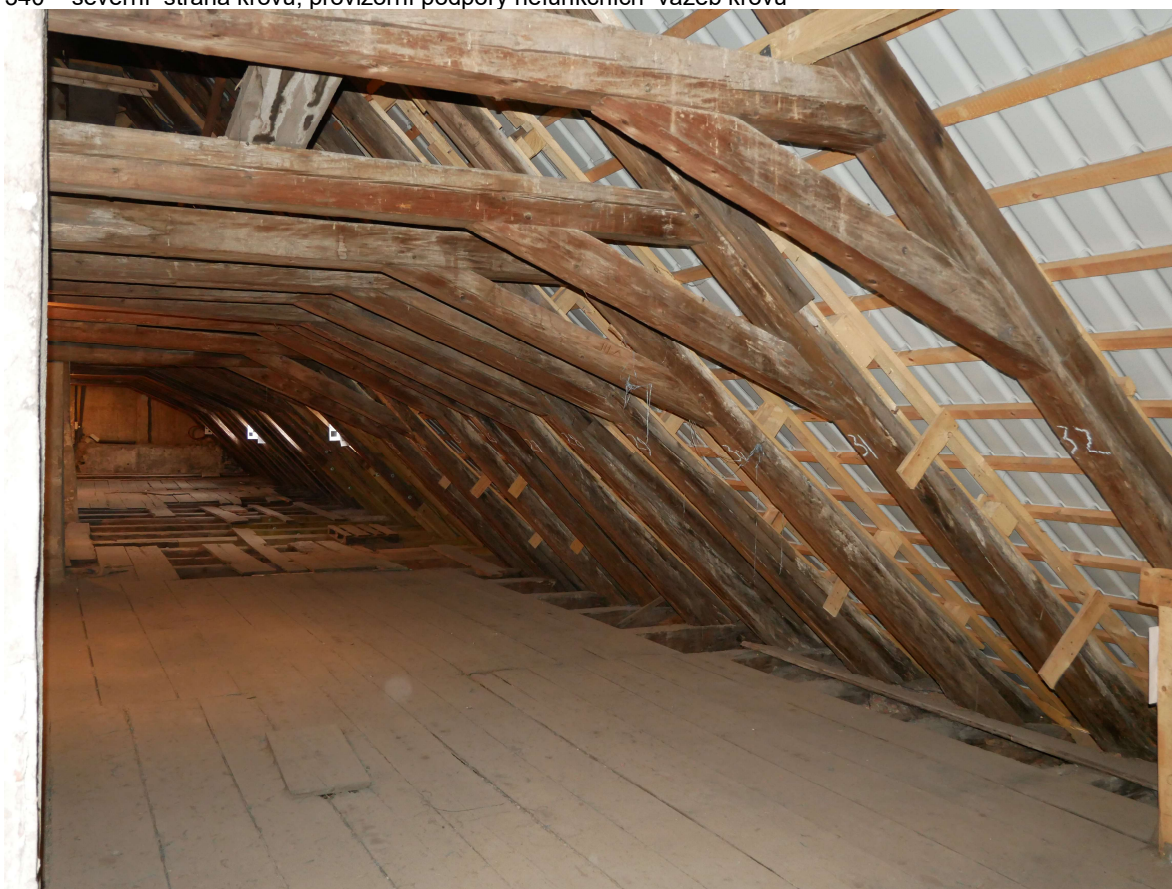
341 – jižní strana krovu, celkový pohled k východu