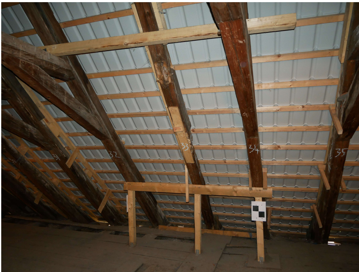
342 – jižní strana krovu, nouzová podpora a přeplátování nefunkční krokve