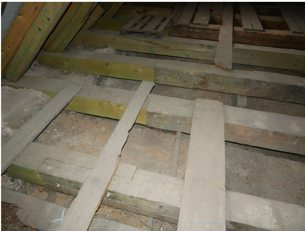
314 – novodobé protézování vazných trámů, přeplátování nedostatečně dlouhé, svorníky poddimenzované