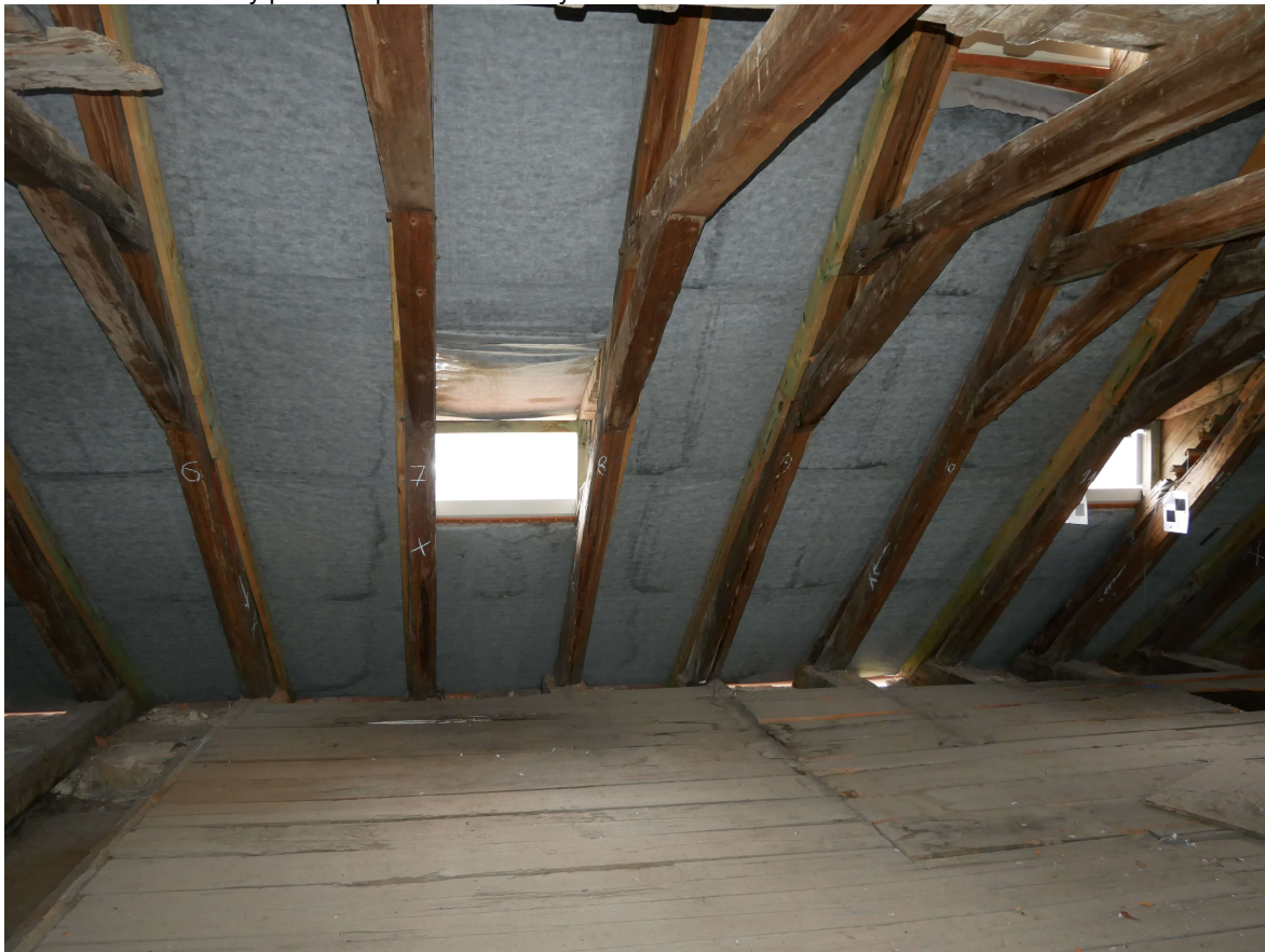
309 – jižní strana krovu, vikýř s chybějící krytinou, otvory dále zatéká