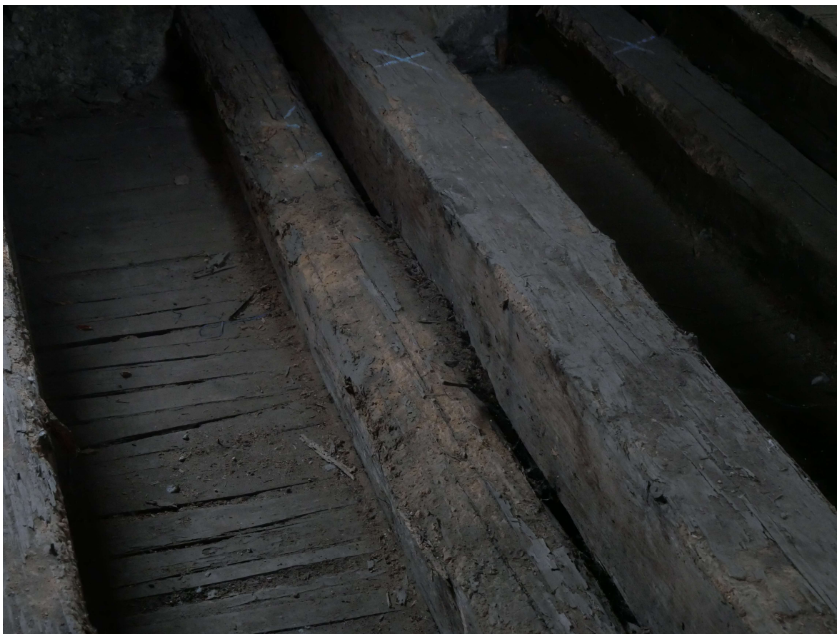
306 – detail destrukce dřeva na rákosnicích a vazných trámech, východní konec stropu nad 2.NP