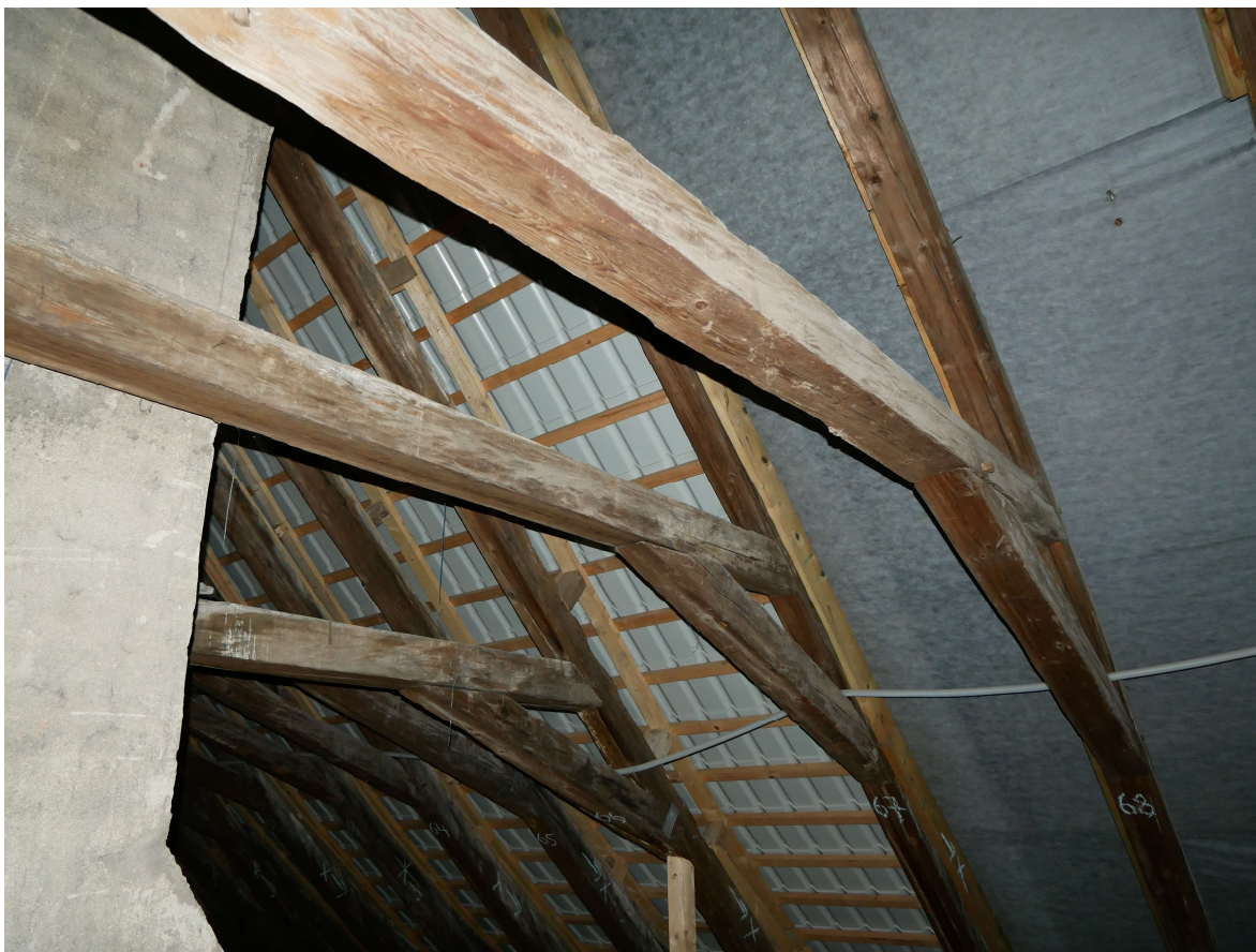
320 – severní strana krovu na úrovni 3. komínu od východu, provizorní plechová krytina, rozsáhlé pomocné prkenné konstrukce na horním lici krokvi pro vyrovnání jejich poklesu a prohnutí