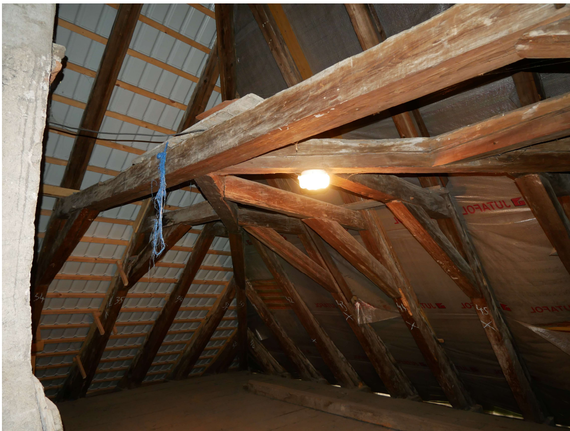
344 – JZ nároží krovu s valbou, nedostatečné vodorovné ztužení v úrovni hambalků, krov se kácí k východu