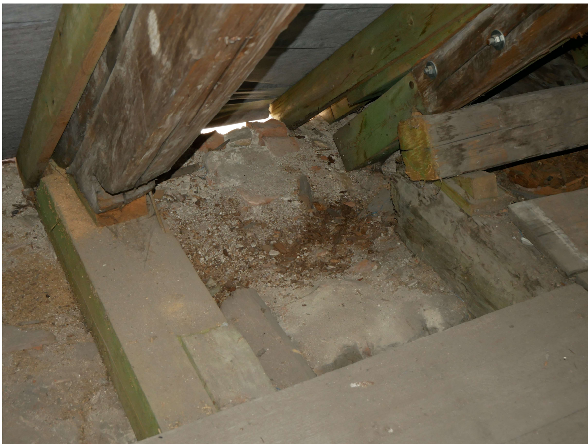
326 – severní strana krovu, destrukce pozednice, protěza krokve, pomocná výměna a příložky z boků krokve