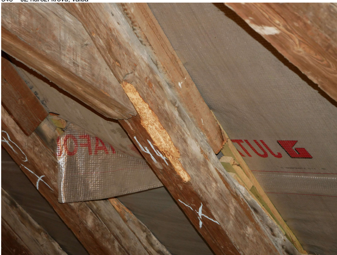
347 – detail poškození a provizorního vyrovnání krokví na valbě